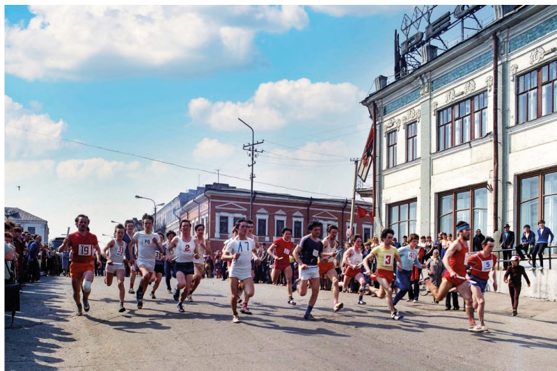
Эстафета Мира, 9 мая 1980 года

ков сделать тугую повязку с охлаждающим эффектом. Вот такой была воля к победе!